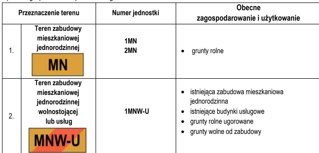
Tabela 7. Obecne zagospodarowanie, użytkowanie obszarów objętych przystąpieniem do sporządzenia miejscowego planu zagospodarowania przestrzennego

Stan środowiska na terenie objętym planem został szczegółowo przedstawiony w Rozdziale 6.