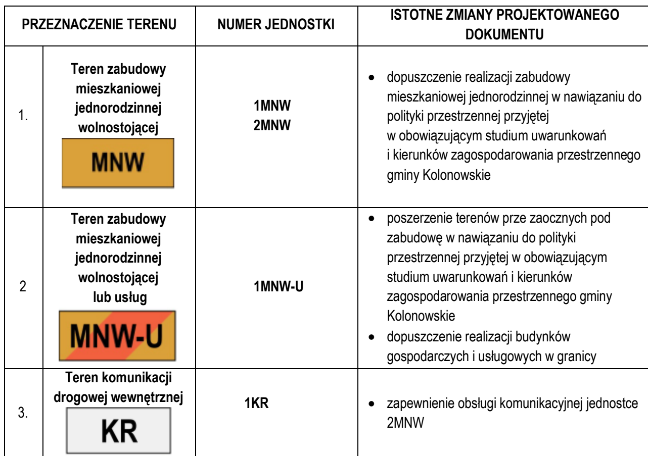
Tabela 10.4. Wykaz klas przeznaczenia terenu wskazanych w projekcie miejscowego planu zagospodarowania przestrzennego (mpzp) oraz uzasadnienie przyjętych rozwiązań z w zakresie przeznaczenia terenu.